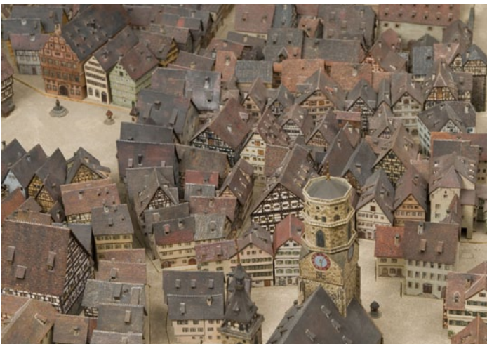
Stuttgart, um 1790. Stadtmodell von Karl und Emma Weingand (Inv.-Nr. S 1354).

Im doppelgeschossigen Zentrum des Foyers begrüßt eine Kunstinstallation die Besucher – dazu wird ein eingeladener Kunstwettbewerb mit der Kunstakademie durchgeführt werden. An der Seite des Foyers soll das bekannte Weingand'sche Stadtmodell stehen, das die Kernstadt in der Zeit von 1760 bis 1790 in idealisierter Form zeigt. Das Modell wird mittels Ausziehelementen ergänzt durch Karten von Merian (1638) und Roth und Abel (1794).